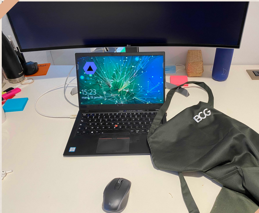
Photo du Bureau